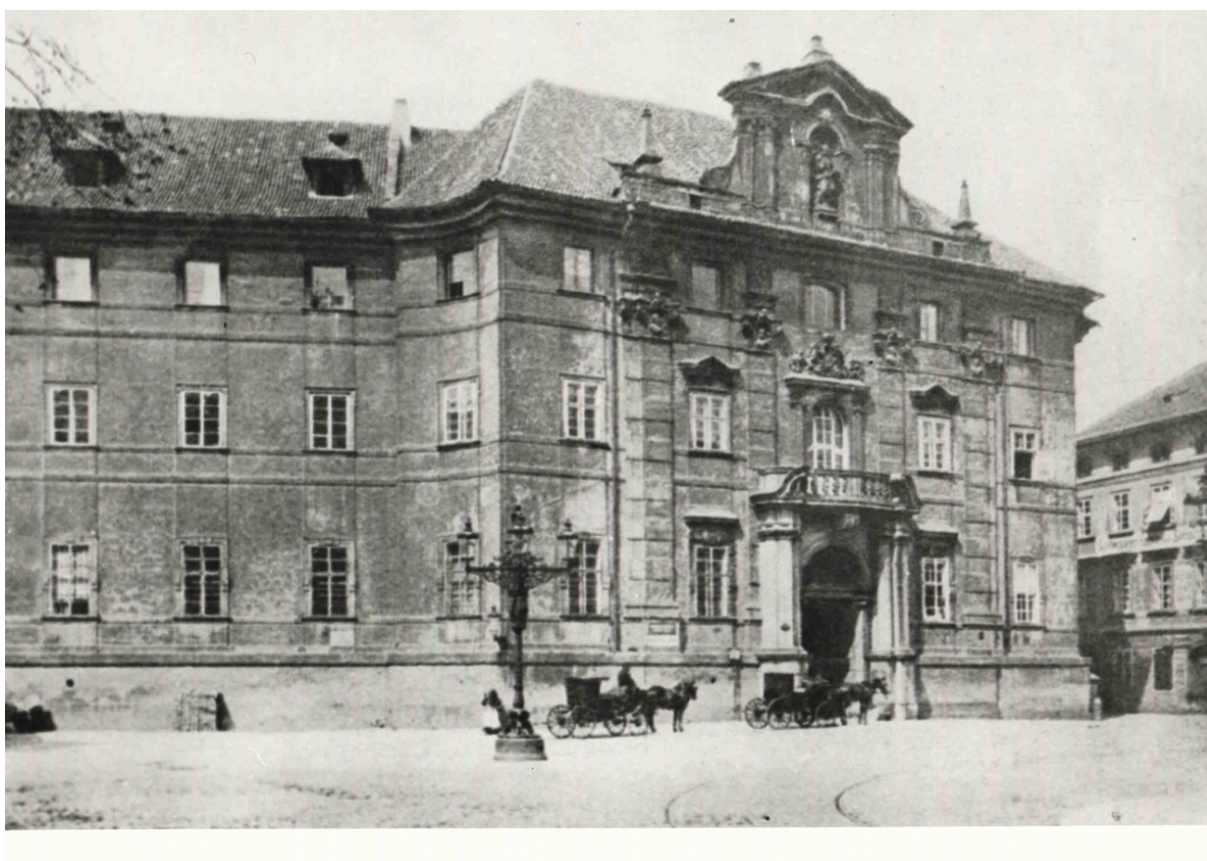
Klementinum z Mariánského náměstí (1883-1901)

Vstupné je 50 Kč, pro studenty a seniory 40 Kč, pro děti do 15 let 20 Kč a děti do 6 let mohou expozici navštívit zdarma.