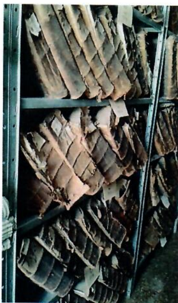
Uložení fondů v Černivci