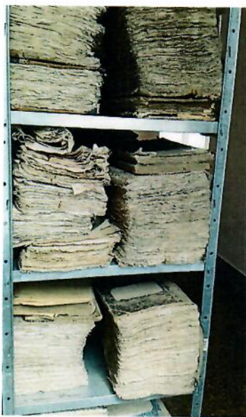
Uložení fondu v Berehovo