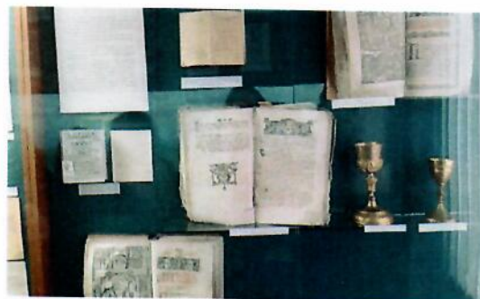
Muzejní expozice v Brodech