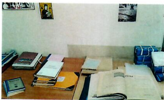
Ukázka opravy vazeb v archivu ve Lvově