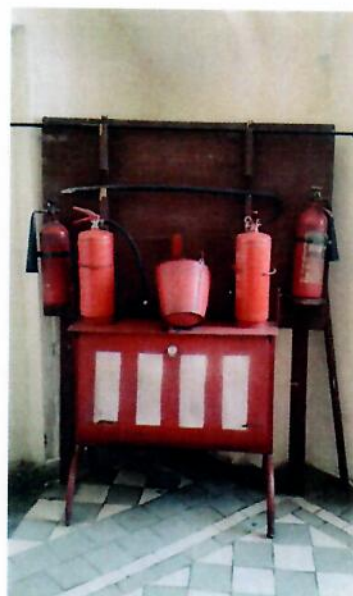
Hasící zařízení v archivu ve Lvově